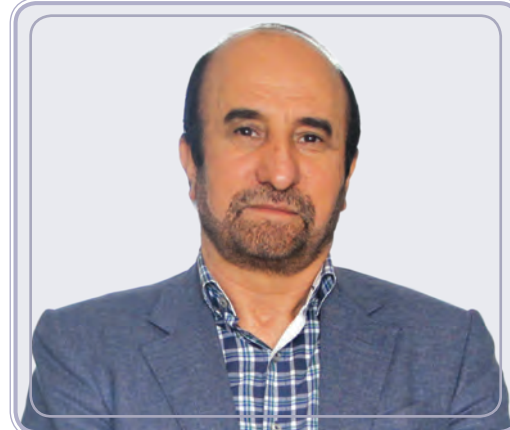
فولادسازی معادن، عجیب ولی واقعی!