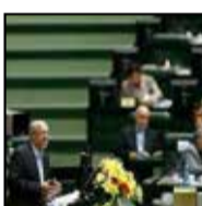
و مانع تعطیلی آنها شد.