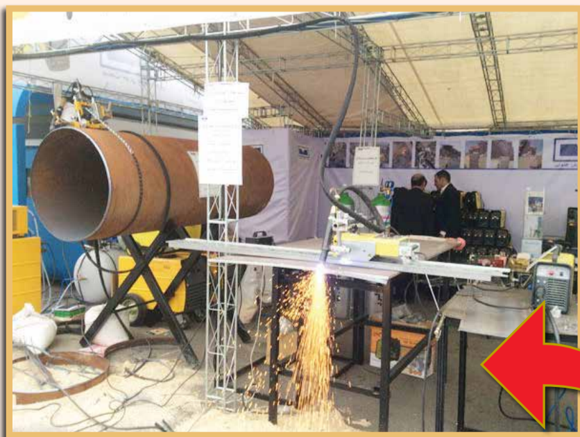
حاشیه غرفه سازی فولادی ها در بیستمین نمایشگاه بین‌المللی نفت، گاز و پتروشیمی

در روزی که نفت تهران و تراکتورسازی فرصت‌سوزی کردند، سپاهان فولاد مبارکه اصفهان جام قهرمانی لیگ برتر را تصاحب کرد.