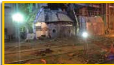
ملاقات دکتر سعید محمدی با مجروحان انفجار در واحد فولادسازی ذوب آهن اصفهان