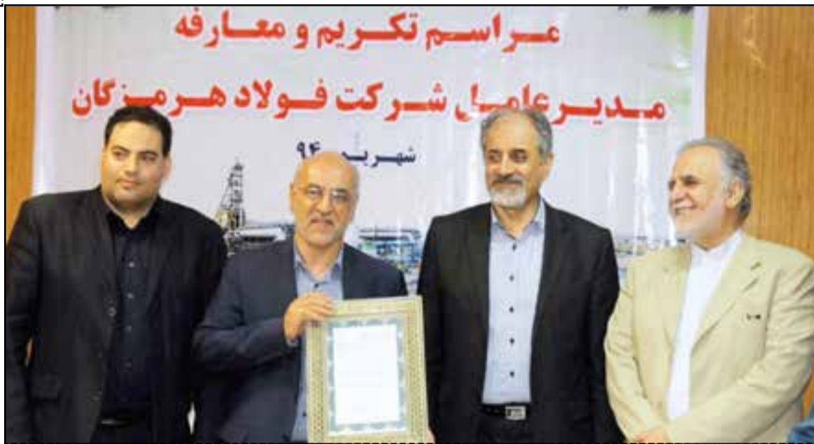
کرباسیان در مراسم تودیع و معارفه مدیرعامل فولاد هرمزگان تصریح کرد: