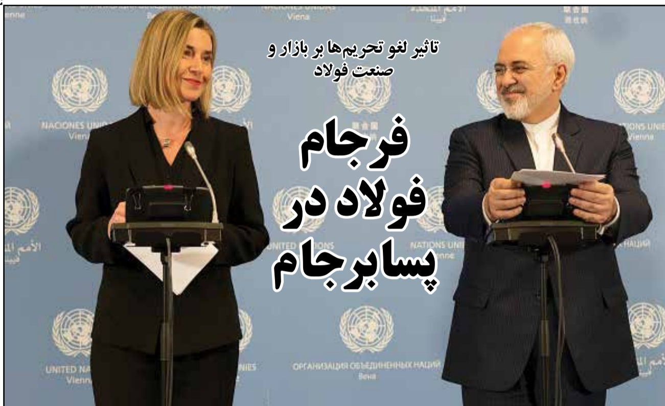
تأثیر لغو تحریم‌ها بر بازار و صنعت فولاد