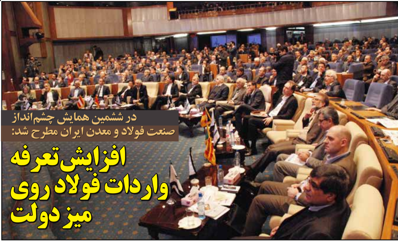
در ششمین همایش چشم انداز صنعت فولاد و معدن ایران مطرح شد: