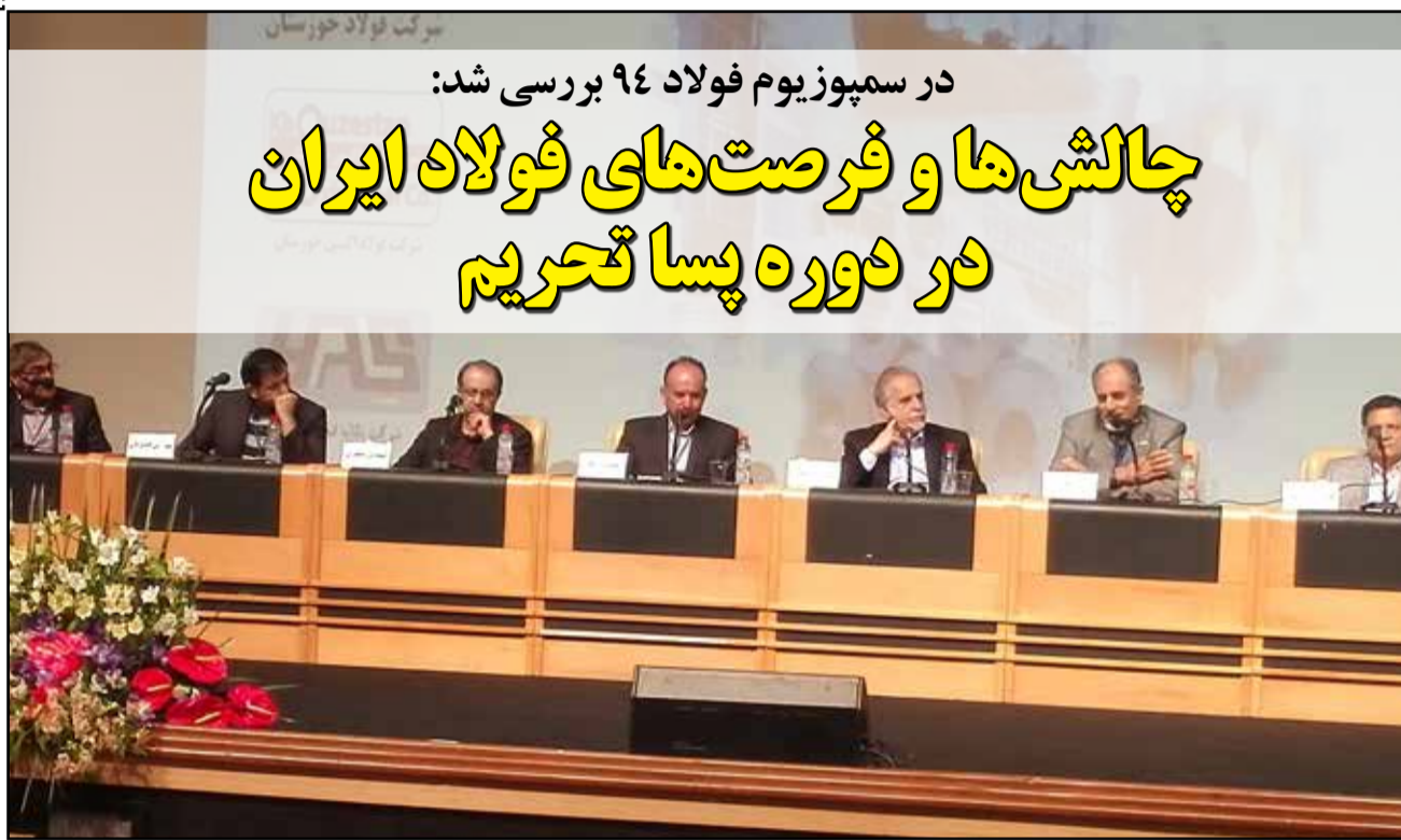
در سمپوزیوم فولاد ۹۴ بررسی شد: