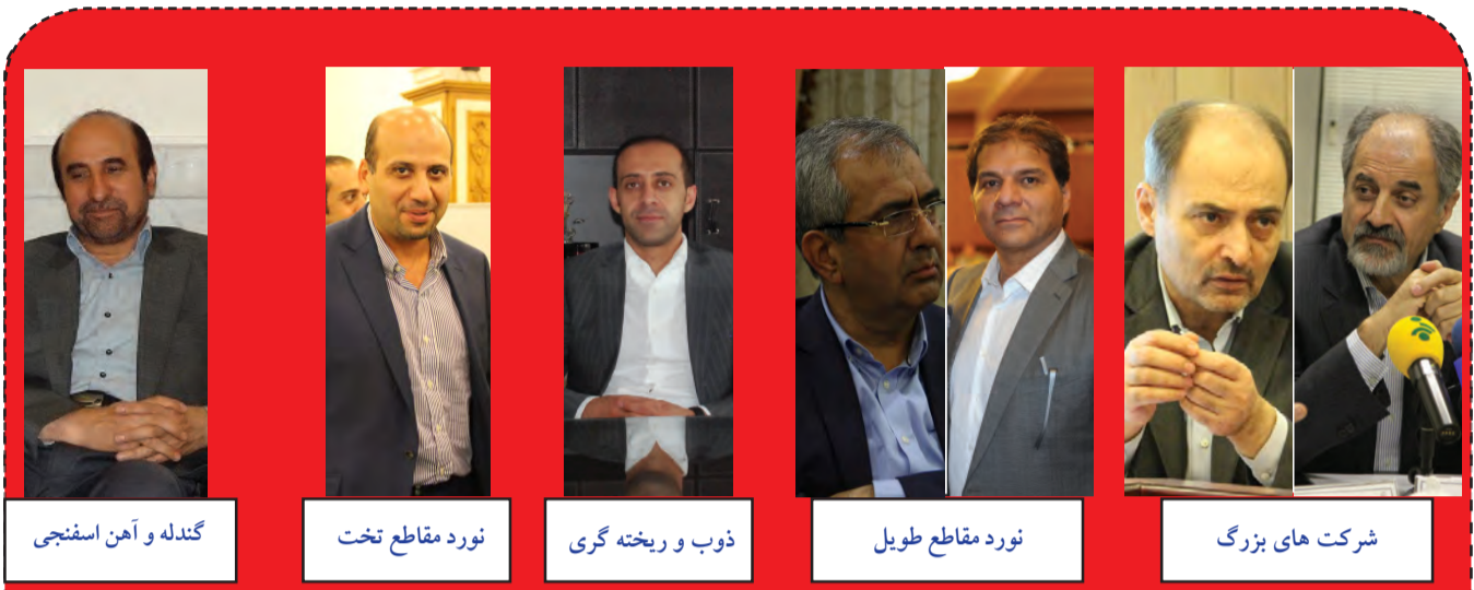
گندله و آهن اسفنجی | نورد مقاطع تخت | ذوب و ریخته گری | نورد مقاطع طویل | شرکت های بزرگ