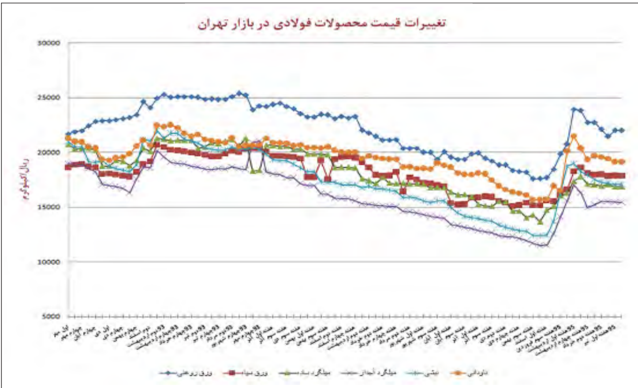
تغییرات قیمت محصولات فولادی در بازار تهران