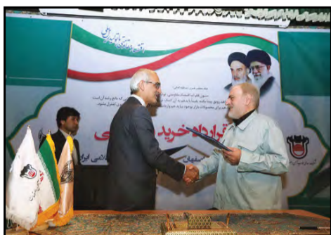
مدیرعامل ذوب آهن و راه آهن قرارداد خرید ریل ملی امضا کردند

قرارداد ریل ملی هفته گذشته (۲۷ مهر ماه ۹۵) با حضور مدیرعامل راه آهن جمهوری اسلامی ایران و مدیرعامل ذوب آهن اصفهان امضا شد.