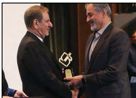
نام دو فولادی در میان واحدهای نمونه کسب نشان واحد نمونه ملی استاندارد

وی طی این مراسم به پروژه های در دست اجرای بنیاد مستضعفان اشاره کرد و گفت: فولاد خرمشهر با ظرفیت ۶۰۰ هزار تنی و کارخانه آلومینیوم خوزستان تا پایان سال به بهره برداری می رسند.