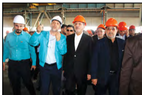
فاز اول فولادسازی مجتمع فولاد کاوه کیش افتتاح شد با حضور اسحاق جهانگیری فاز اول فولادسازی و پروژه آب شیرین کن ۱۵ هزار مترمکعبی فولاد کاوه جنوب کیش به بهره برداری رسید.

ذوب آهن اصفهان تاکنون پنج بار در سالهای ۱۳۸۰-۱۳۸۵-۱۳۸۸-۱۳۹۱-۱۳۹۲ صادرکننده نمونه ملی کشور و در سال ۱۳۹۳ صادرکننده ممتاز کشور شده بود.