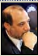
عرضه اوراق خاص به صنعتگران تکذیب شد

۱ ♦ بولتن داخلی انجمن تولیدکنندگان فولاد ایران ♦ شماره بیست و یکم ♦ نیمه دوم شهریورماه ۱۳۹۰ ♦