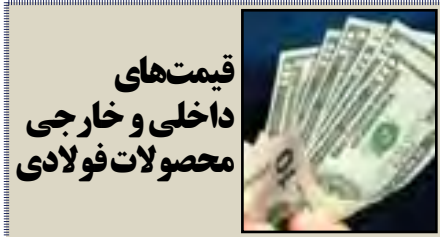
قیمت‌های داخلی و خارجی محصولات فولادی