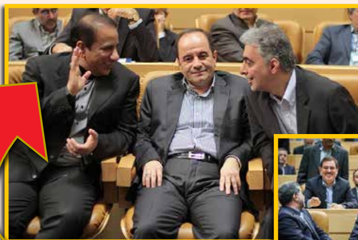
در حاشیه مراسم گرامیداشت روز صنعت و معدن