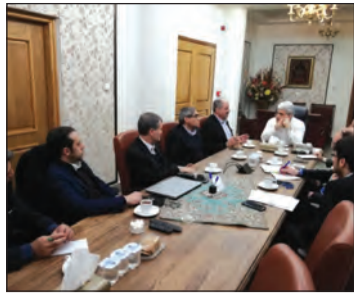
زنجیره فولاد به معاون اول رئیس جمهور رسید