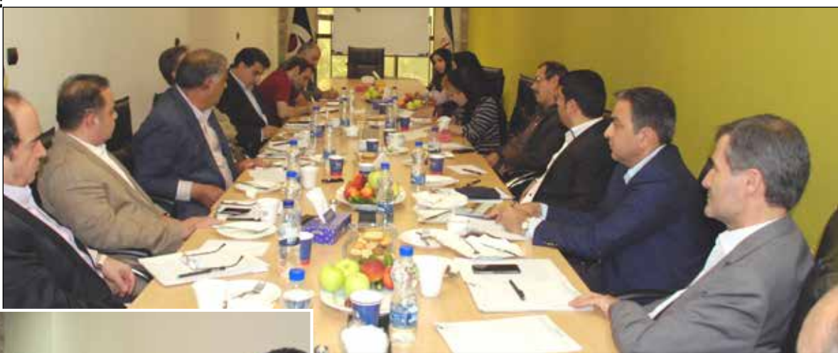
برگزاری نشست انجمن تولیدکنندگان فولاد ایران در خصوص ابلاغیه وزیر