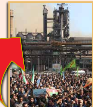
آیین تشییع شهدای گمنام دفاع مقدس در ذوب آهن اصفهان