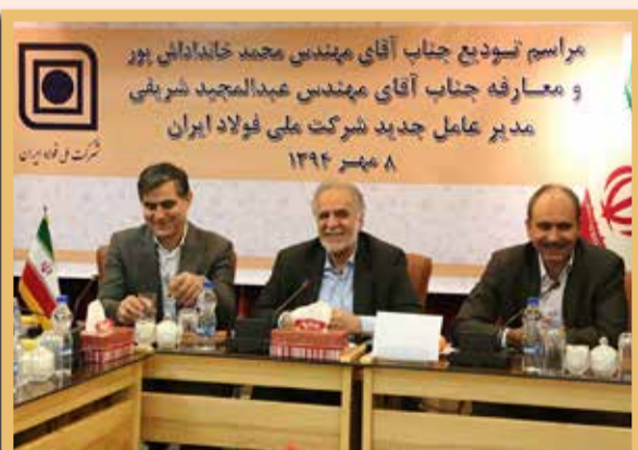
مراسم تودیع و معارفه مدیران عامل سابق و جدید شرکت ملی فولاد