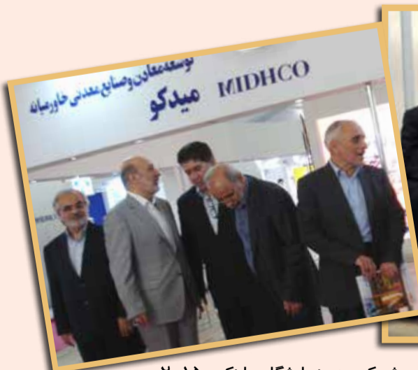
حضور چیلان در غرفه ی هلدینگ میدکو با مدیران این شرکت در نمایشگاه ماینکس ۲۰۱۵