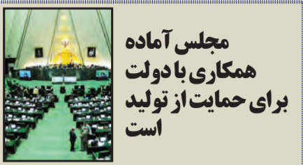
مجلس آمادگی همکاری با دولت برای حمایت از تولید است

۱۰ بولتن داخلی انجمن تولیدکنندگان فولاد ایران شماره بیست و پنجم نیمه دوم آذر ماه ۱۳۹۰