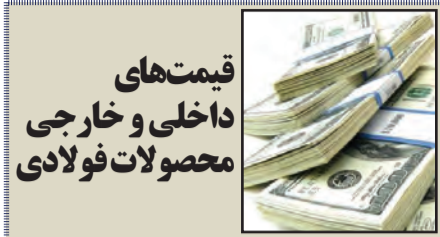
قیمت‌های داخلی و خارجی محصولات فولادی